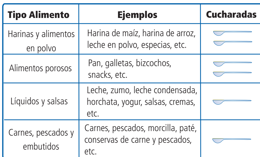
Tabla 1. Cantidad de muestra según tipo de alimento

9.3. Añada el contenido de la cucharilla suministrada, el gramo o el mililitro, al bote de extracción de tapón amarillo .