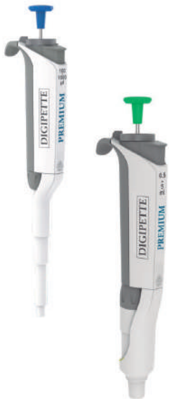
Ref. - MGB095